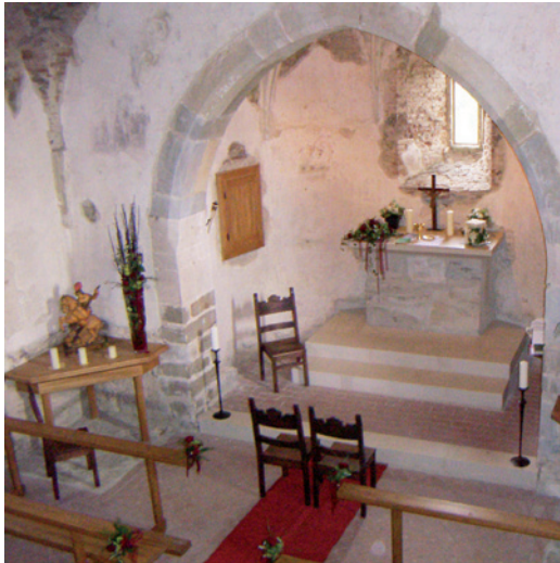
Die einzigartige Kapelle