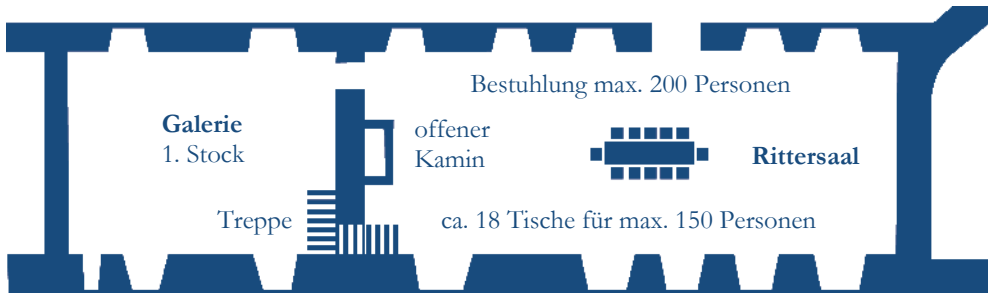
Skizzen nicht Massstabsgetreu!